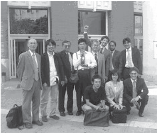
写真2：LIBRAのメンバーとの記念撮影

政機関の意向が働いてしまい、本当に市民が応援したいNPOに必ずしも十分な資金が回らないので、少なくともこのLIBRAでは市民一人ひとりにその決定権を与えようというものです。ですから子どもを取り巻く環境に関心がある人であれば子育て支援を行うNPOに、地域の自然に関心がある人であれば地域の環境保全を行うNPOに、文化活動に関心がある人であればたとえば地元の劇団に寄付をすることで、財布を痛めることなく自分の応援する活動を推進することができるわけです。買い物は企業を支援する投票行動だとよく言われますが、ここではドーナスポイントの寄付がNPOを支援する具体的な投票行動になるわけです。