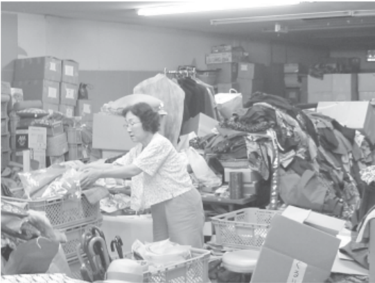
リサイクルショップの倉庫

給料は出ても、障害者の手に渡るものではありません。「生きがいとして」施設にかよい、訓練や作業をしても、賃金どころか、費用を徴収されているのが現実です。選択肢のない、家と施設だけの限られた生活の場は、夢があることも、そして夢をもつことさえも、知らずに一日が流れているのではないでしょう。