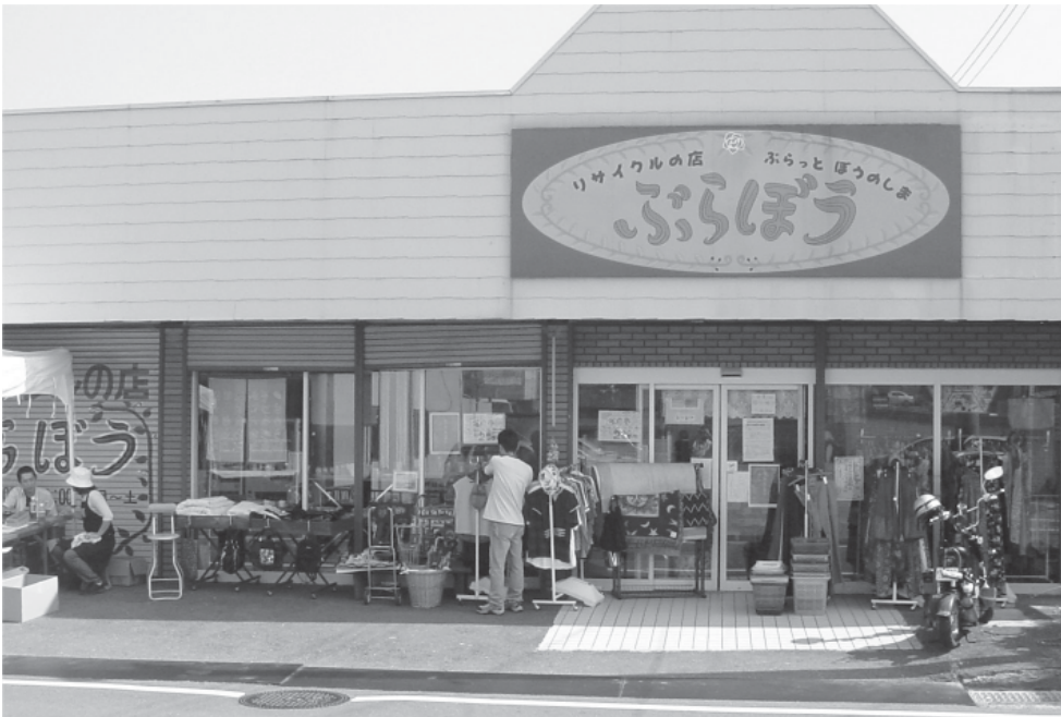
リサイクルショップ「ぶらぼう」の外観