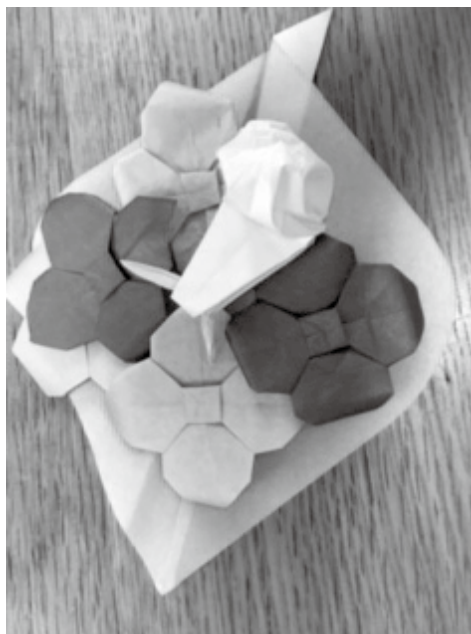
おりがみで折ったあじさい

現在、すでに休職し、続けて産休育休をとらせて頂くことになっている。3年数ヶ月の間、会員の皆さまにはたくさんのご協力をいただいたと改めて実感し、感謝している。今後は、一会員として協同総研の活動を応援しながら、自分にしかできない仕事を果たすため、今日も休み休み過ごしたいと思う。